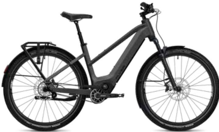
7.33 Mixed, Black Shading Satin