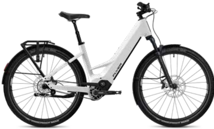
7.33 Comfort, Pearl White Satin