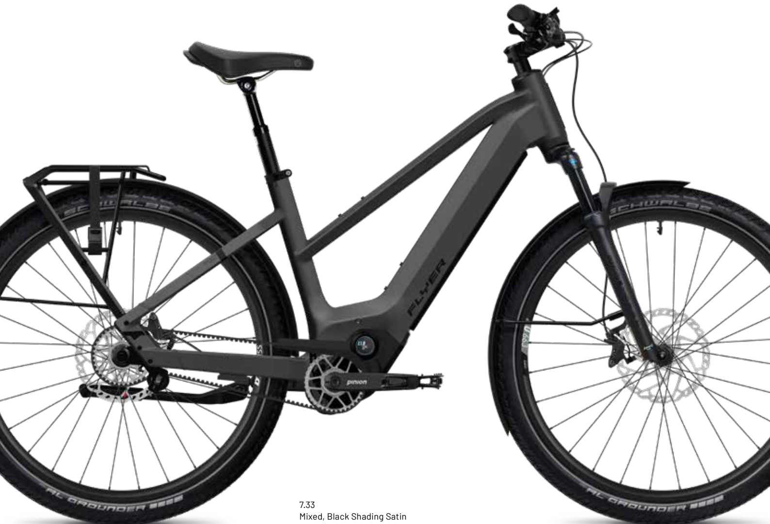
7.33 Mixed, Black Shading Satin

Een bijzonder highlight: de automatische versnellingsbak past zich automatisch en zeer soepel aan uw rijgedrag aan, zodat u moeiteloos door het stop-and-go verkeer manoeuvreert.